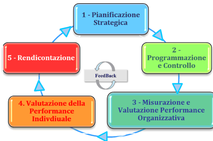
Fig.1 – Ciclo della performance