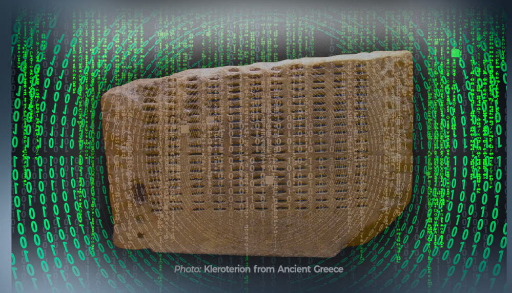
Photo: Kleroterion from Ancient Greece