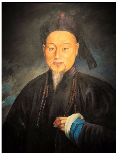
表紙絵関連「編集後記」