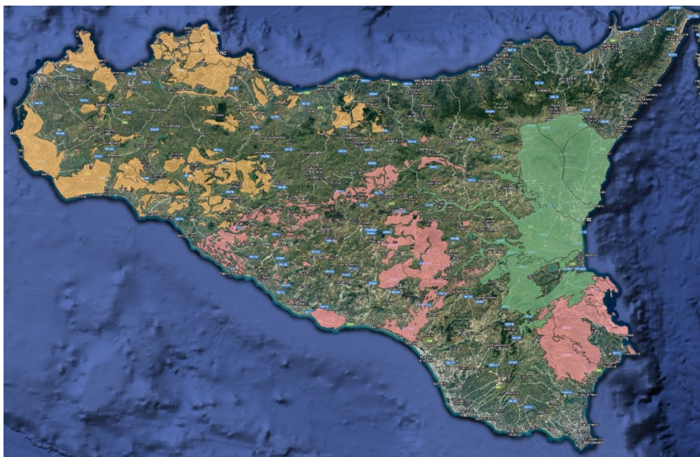
Figura 1 – Assegnazione dei corpi idrici superficiali (UNICT_DSBGA, verde; UNIME_MIFT, rosso; UNIPA_DiStEM, arancione).