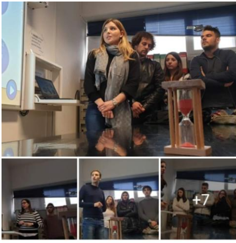
Laboratorio di startup

Panorama / Panorama d'Italia / Palermo / Concorso "Sicilia, un'idea per il territorio": i 3 vincitori