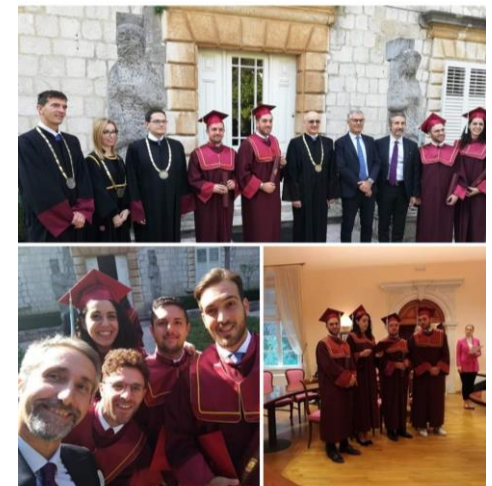
Laurea LM-77 a Dubrovnik