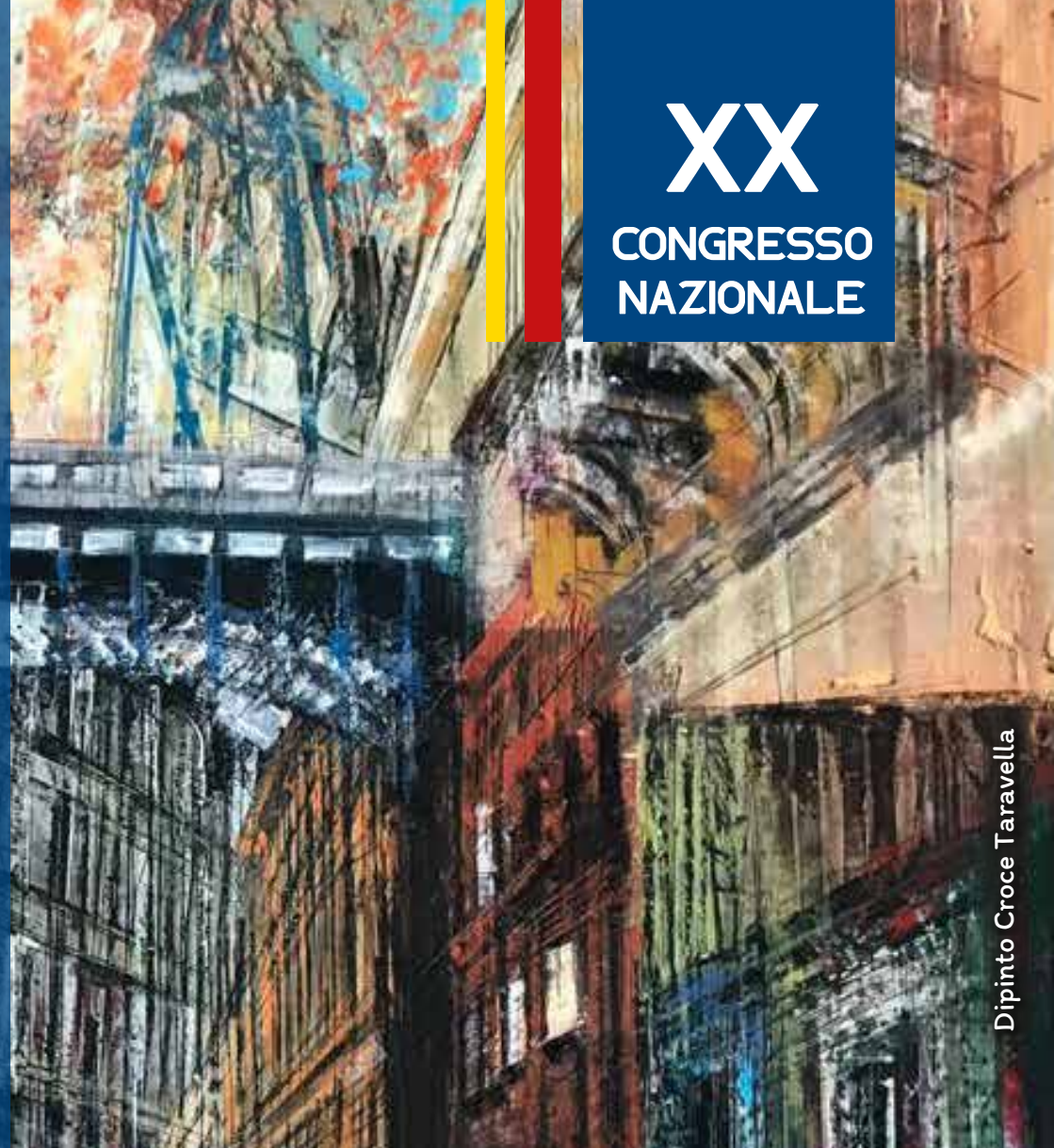
Dipinto Croce Taravella

23-24 settembre 2021 Palermo, Edificio 19 Campus Universitario