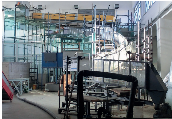
Modello-Giampileri in scala realizzato presso il Dicam

gegneria civile e ambientale. Diversi i progetti di ricerca portati avanti in questi tre anni, con risultati lusinghieri resi possibili oltre che dai finanziamenti ricevuti da agenzie di ricerca anche dalla vasta rete di collaborazioni internazionali con prestigiose università straniere. Tra queste, Università di Innsbruck, Politecnico di Vienna, University of Illi-