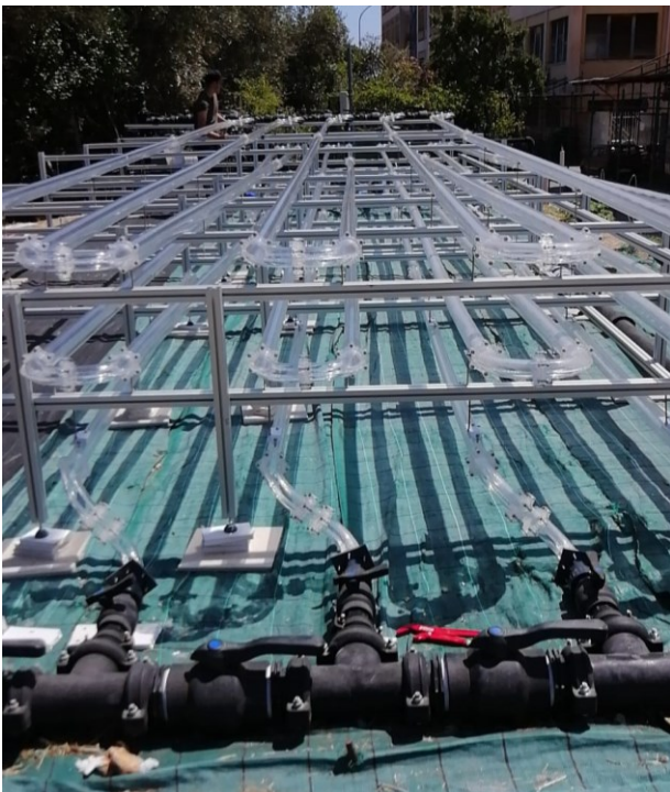
Fig. 3: Particolare su valvole e flange di connessione