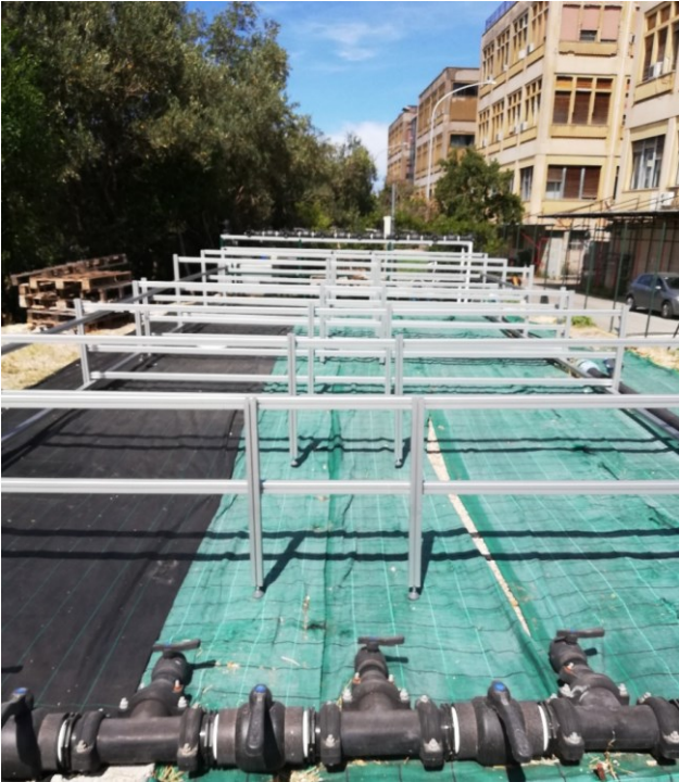
Fig. 1: Impalcatura in alluminio per sorreggere i tubi