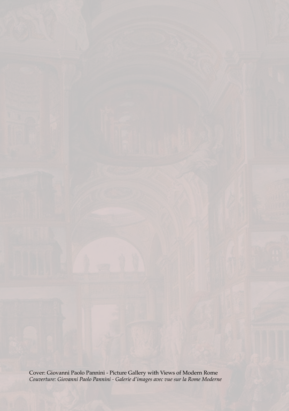
Cover: Giovanni Paolo Pannini - Picture Gallery with Views of Modern Rome Couverture: Giovanni Paolo Pannini - Galerie d'images avec vue sur la Rome Moderne