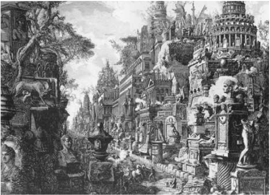
Giovanni Battista Piranesi, Le antichità romane , 1756

La Société Italienne d'études du XVIII e siècle a le plaisir de présenter la candidature de Rome comme siège du Congrès International de la SIEDS/ISECS dans les Universités La Sapienza et “Tor Vergata” de Rome, du 3 au 7 juillet 2023. Le sujet proposé est L'Antiquité et la construction du futur à l'âge des Lumières , un thème qui s'adapte particulièrement à la ville de Rome, exemple unique de dialogue entre l'Antiquité et la modernité au XVIII e siècle.