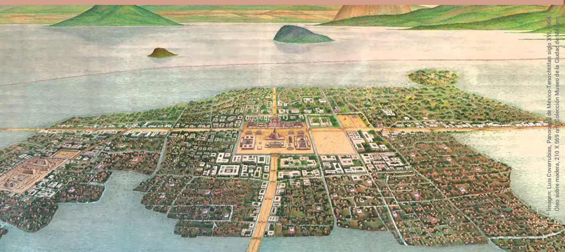
Ilustración: Luis Governubias, Patronato de México-Tenochtitlan, siglo XVI. Colección: Museo de la Ciudad de México.