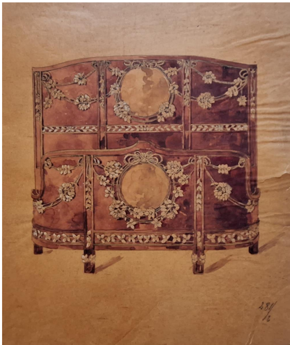
Ufficio Tecnico Ducrot, lettone della stanza da letto presentata all'Esposizione Internazionale del Sempione di Milano del 1906 ; ridisegno da fotografia del mobile realizzato dagli «Stabilimenti Ducrot - Palermo» su disegni di Ernesto Basile, con la collaborazione di Giuseppe Enea per le pitture Vernis Martin. Matita e inchiostro di china acquarellato su carta da lucido; Archivio Ducrot, Collezioni Scientifiche del Dipartimento di Architettura, Università degli Studi di Palermo.