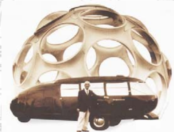
Robert Buckminster Fuller, ritratto nel 1981 con la sua cupola geodetica 'Flu's Eye' e il trerote 'Dymaxion' del 1934.

Aula Laboratorio E Polo Didattico di Agrigento