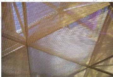
Copertura del Nuovo Dipartimento delle Arti Islamiche realizzato nella Cour Visconti del Louvre, progetto Mario Bellini e Rudy Ricciotti, Parigi 2012.

Aula Laboratorio E Polo Didattico di Agrigento