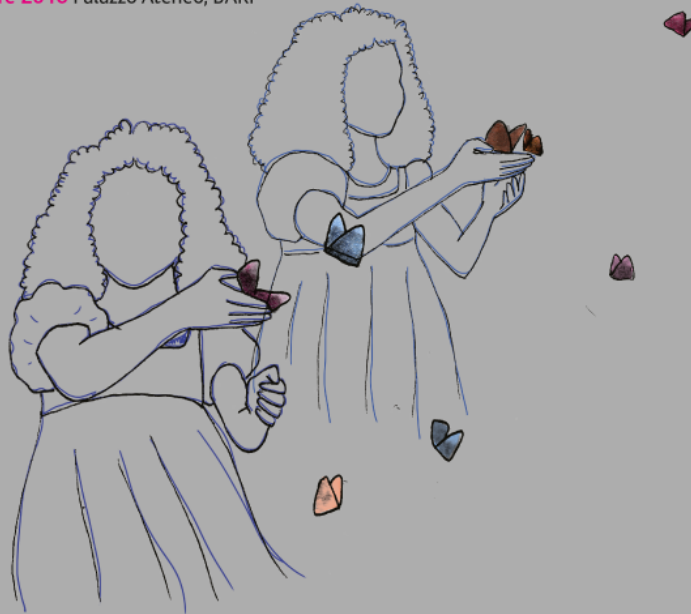
Illustrazione e grafica di Clara Petrella