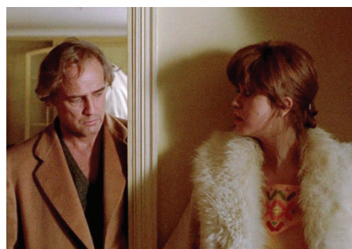
Ultimo tango a Parigi (1972)