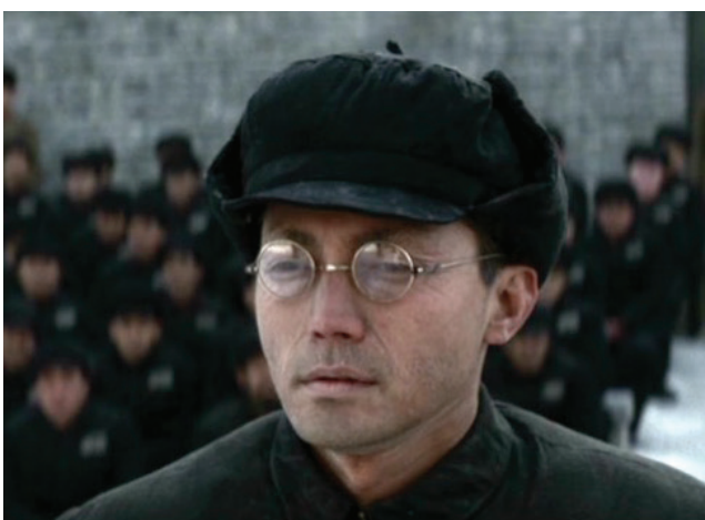
L'ultimo imperatore (1987)