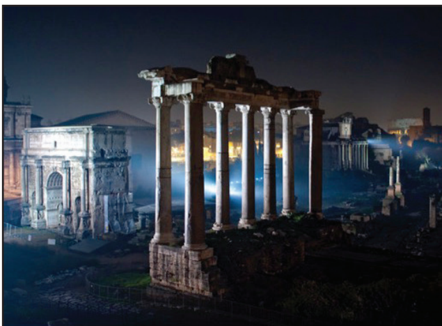
Roma. Illuminazione dei Fori imperiali (1999)

Voglio infine ricordare due delle attività solo apparentemente più marginali del lavoro di Vittorio Storaro, perché aggiungono un tassello in più a questo tentativo maldestro di ricostruire, con poche parole e molta riconoscenza, la figura di un artista e intellettuale così complesso. Dal 1994 al 2004, Storaro svolge attività di docenza all'Accademia dell'Immagine dell'Aquila, mostrando di riservare un'attenzione non secondaria alla divulgazione del senso e del valore dell'arte, condotti bene al di là dell'espressione di un mondo privato (quello singolare dell'autore) e riferiti sempre ad un soggetto plurale – una comunità potremmo anche dire – posta nella condizione di poter accogliere, comprendendolo, il lavoro dell'artista. L'opera d'arte ha dunque, sempre, in questa prospettiva, una collo-