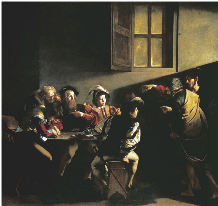
Michelangelo Merisi da Caravaggio, La vocazione di san Matteo, olio su tela, Roma, Chiesa di san Luigi dei Francesi, Cappella Contarelli

L'immagine cinematografica (non più analogica, ma digitale) mostra qui, ancora più radicalmente che altrove, forse, la sua matrice pittorica, che d'altro canto Storaro non ha mai dimenticato di dichiarare esplicitamente, rivendicando un richiamo diretto, nel proprio modo di lavorare con la luce, alla pittura di Caravaggio e alla sua capacità di lasciare emergere, grazie all'incontro fra luce e ombra, la potenza e la fragilità della figura umana, come accade ne La vocazione di San Matteo , il capolavoro caravaggesco, all'incontro con il quale, in più di un'occasione, Storaro ha sostenuto di poter far risalire l'origine, almeno simbolica, del suo lavoro con la luce (ce ne parlerà tra poco nella sua lectio magistralis ).