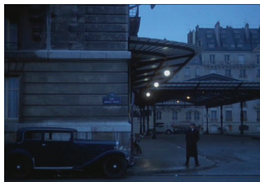
Il conformista (1970)