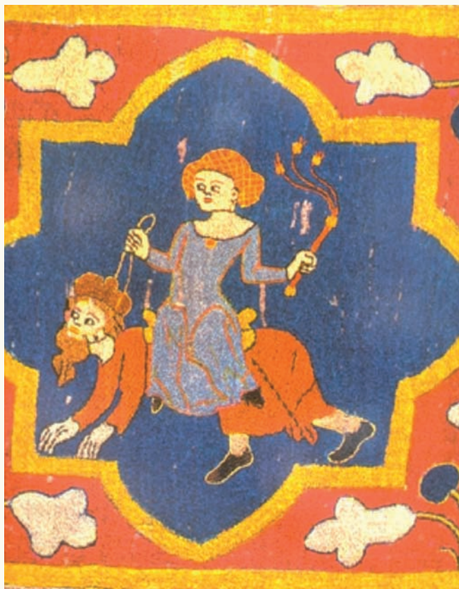
Aristotele e Fillide, XV secolo

Libreria Kursaal Kalhesa, Foro Umberto I, 21 - Palermo