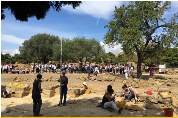
Scavi ad Agrigento, Valle dei Templi