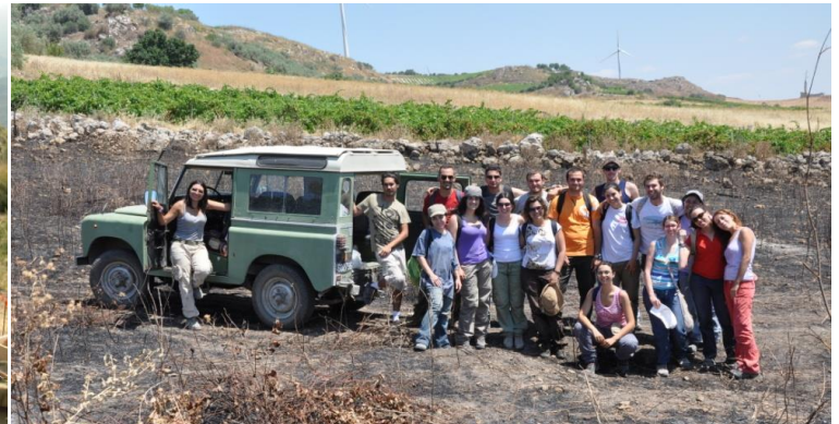
Survey Cignana (Palma di M.) Scavi Alesa (Castel di Tusa)