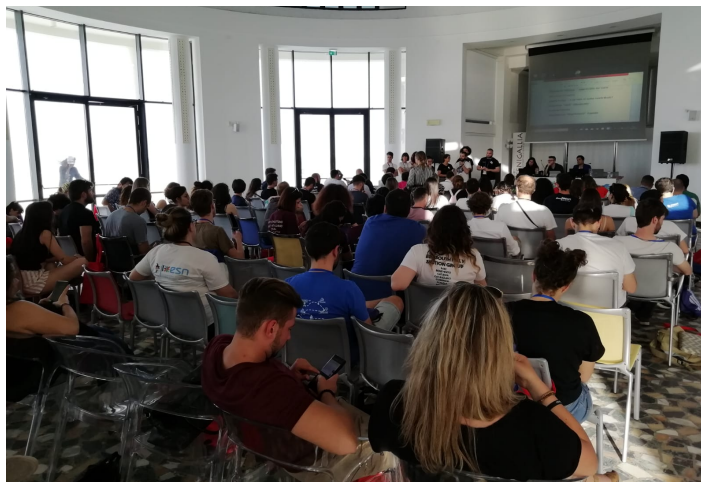
(l’Assemblea di ESN Italia)

Da questo momento, per il periodo di prova che durerà dai 6 ai 12 mesi, il Comitato si chiamerà “ESN Trapani - Sezione Candidata” di ESN Italia. Al termine di questo percorso, l’Assemblea Nazionale di ESN Italia deciderà se le attività della sezione candidata trapanese risulteranno conformi agli standard dell’Associazione e quindi renderci una Sezione ufficiale del network..