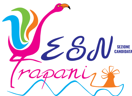
(Prototipo del nuovo logo del team)

Ora più che mai “ESN Trapani Sezione Candidata” chiama: studenti, tirocinanti, docenti, imprenditori, associazioni, rappresentanti delle istituzioni e del territorio, tutti i cittadini volenterosi, a prestare il proprio supporto e promuovere collaborazioni destinate a generare opportunità per tutti sotto i profili personali e sociali.