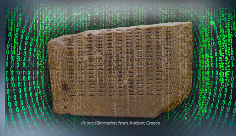
Photo: Kleroterion from Ancient Greece